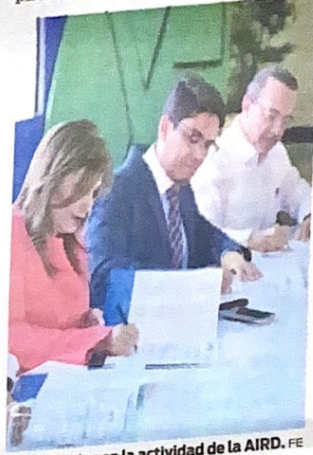
Participantes en la actividad de la AIRD. F.E

Esto, bajo un modelo de gestión de residuos basado en responsabilidad compartida y beneficio mutuo. Dijo que esa es su misión y ese es el liderazgo que aspira construir en la sociedad. el Caribe